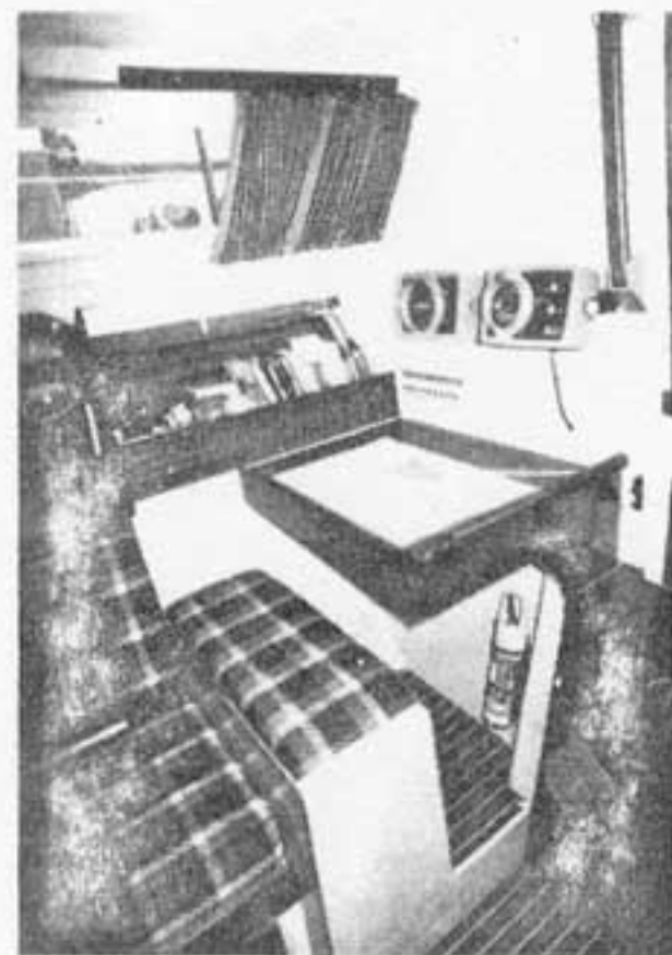
De Dufour 29 heeft een vaste kaartentafel met stoeltje

De Dufour 29 heeft goede zeileigenschappen. Wij voeren op het IJsselmeer met windkracht circa 2-3 Beaufort en rustig water. Met grootzeil en genua ligt het schip onder deze omstandigheden goed op het roer en is in geringe mate loefgierig. De snelheid bij circa 43 = aan de wind zeilend was op onze niet-geijkte log circa 4,5 knoop en met halve wind circa 5 knoop. Het manoeuvreren verloopt goed doch aanmerkelijk trager dan bij de Dufour 2800. De koersstabiliteit is goed. De boot is makkelijk te sturen. De bediening van de zeilen verloopt makkelijk alleen de overloop van de grootzeilschoot gaat wat zwaar. Varend op de motor manoeuvreert de boot goed en draait makkelijk. De draaicirkel ligt binnen één scheepslengte; de stopweg ligt op circa twee lengtes. De maximum vaarsnelheid op de motor is circa 6,5 knoop.